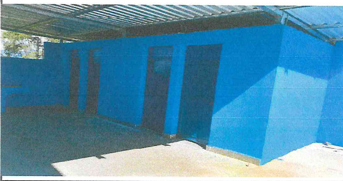
Foto 3: SUSTITUCIÓN DE LOSA DE PATIO Y LÁMINA TROQUELADA EN ÁREA DE BAÑOS Y PILA,