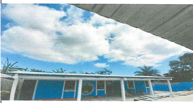
Foto1: SUSTITUCIÓN DE LÁMINA POR LÁMINA TROQUELADA